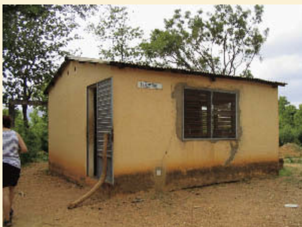
Rechts: Nieuwe Laboratorium