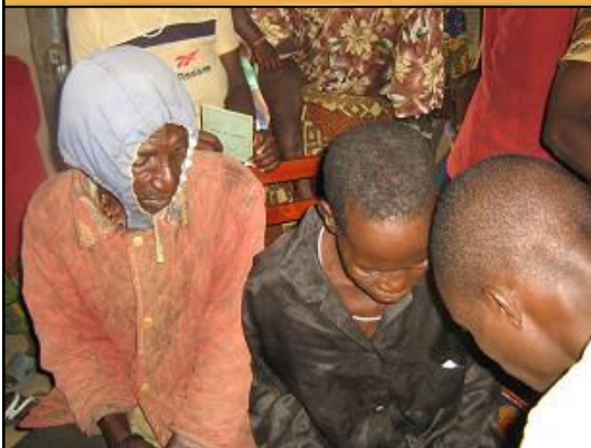
ze wachten al