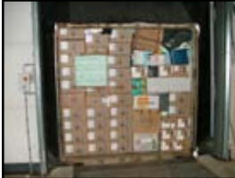
Container vershippen inclusief medicijnen