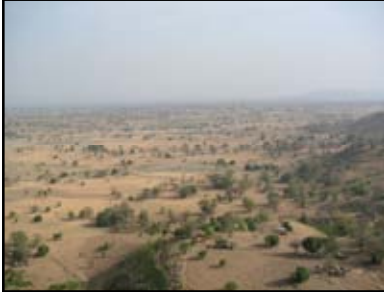
8 maanden zeer droog