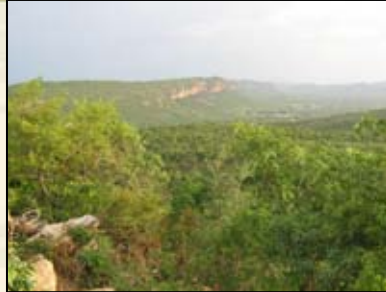
Oktober direct na de regenperiode