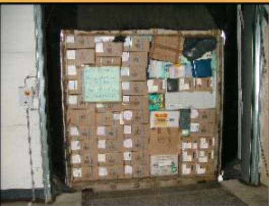
Container verschepen Incl. medicijnen