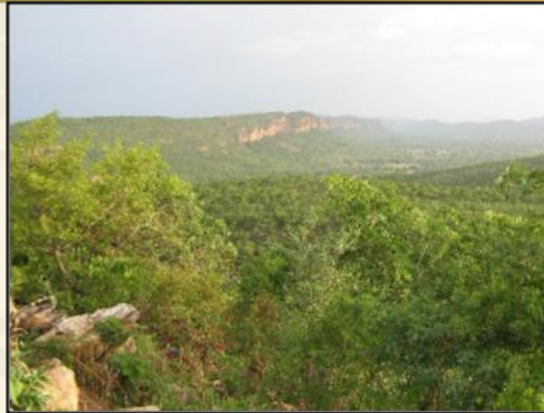
Oktober direct na de regenperiode