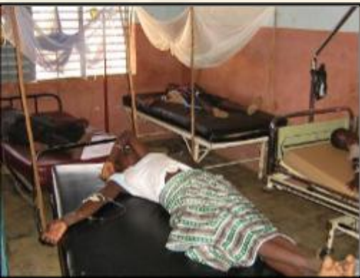
zoals het was...