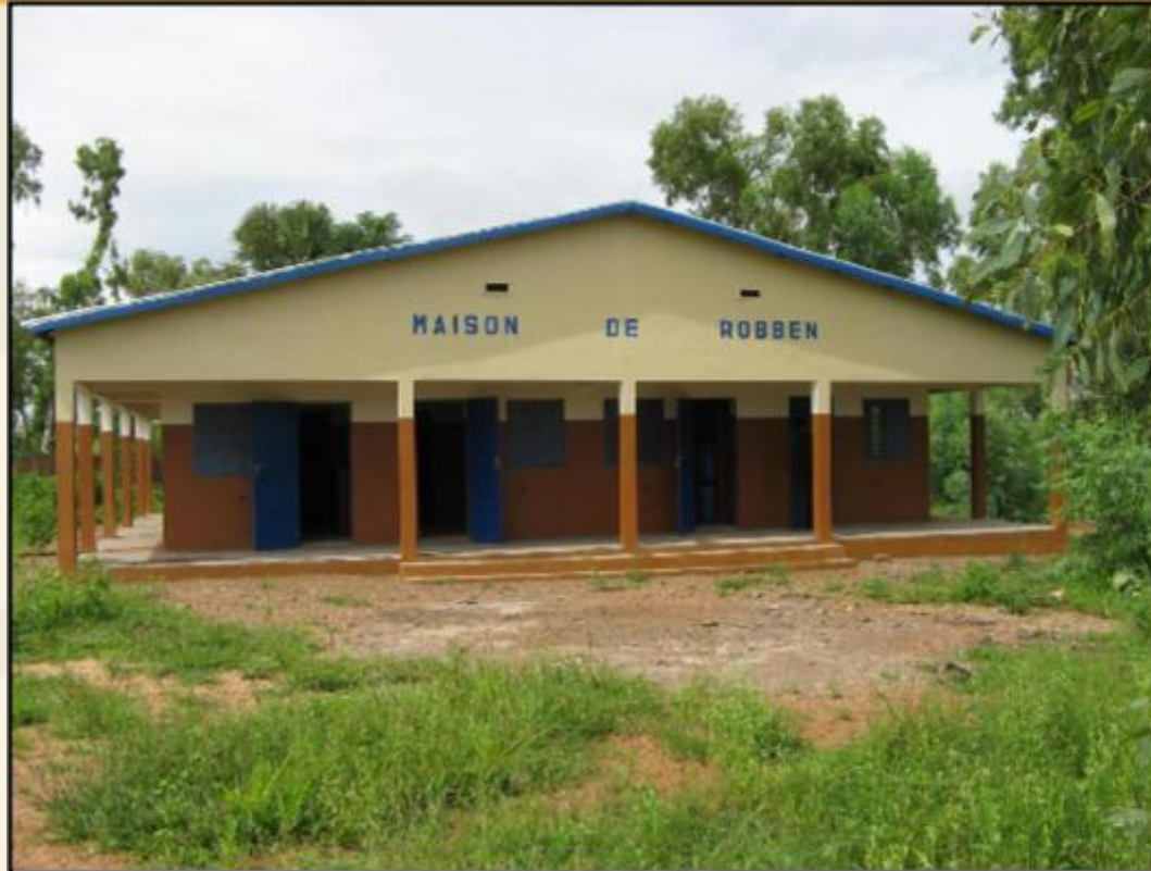
9 okt. 2008 1e baby geboren in het Robbenhuis