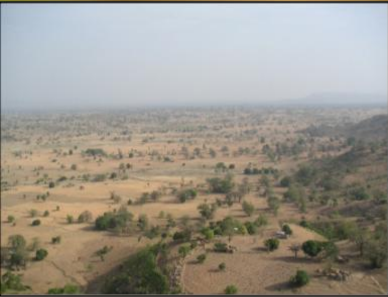
8 maanden zeer droog